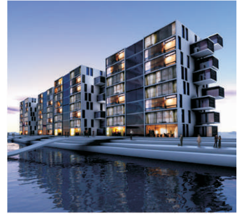
3.Mejora de la comunicación con el cliente

► Es el momento de reorganizar su estudio de arquitectura Hacia una mayor calidad y competitividad. Allplan Arquitectura