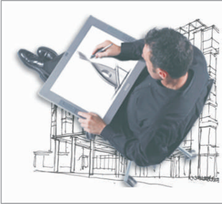
1.Optimización del diseño